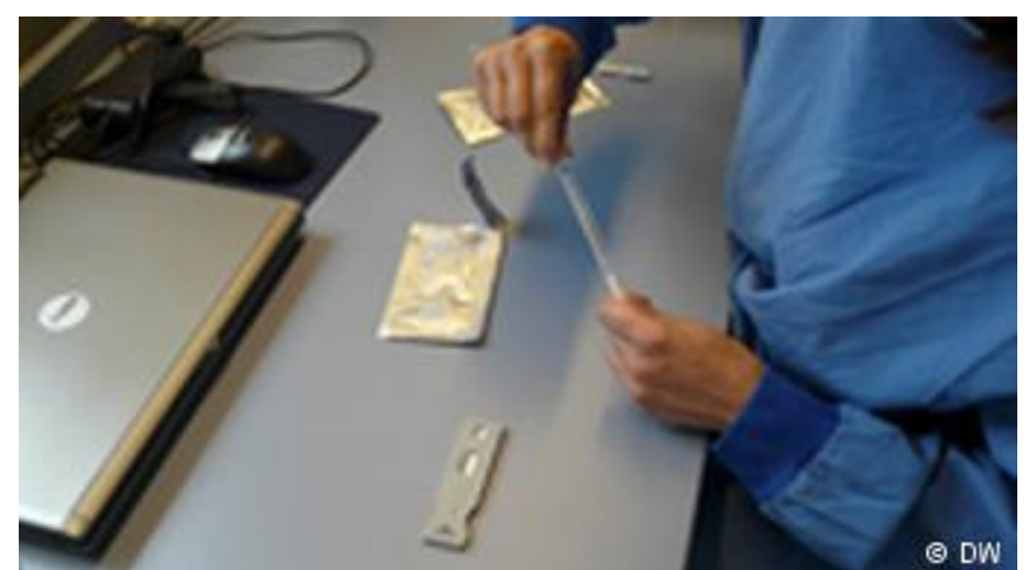
Weitere Forschung ist nötig