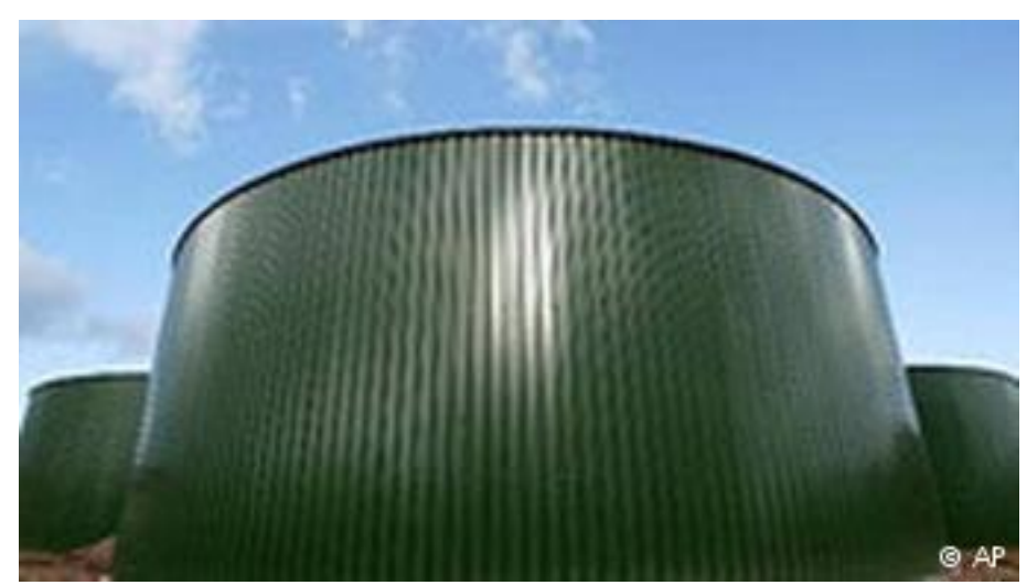
Was kommt herein? Was kommt heraus?

"Da die Krankheit in dieser Form nicht als Krankheit anerkannt ist, können und wollen die Behörden nicht tätig werden, weil sie nicht